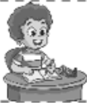
Hacer la tarea