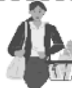
Hacer las compras