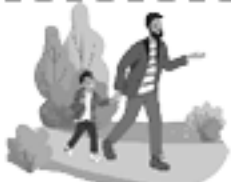
Llevar a los niños a la escuela