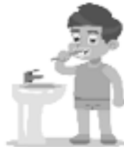
Cepillarse los dientes