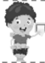
Ir al baño