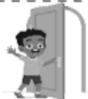
Regresar a casa