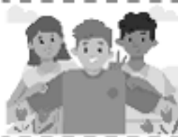
pasar tiempo con amigos