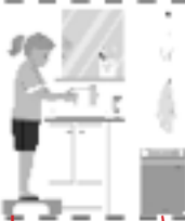
Lavarse las manos