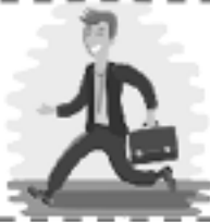
Ir al trabajo