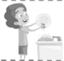
Lavar los trastes