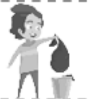
Sacar la basura