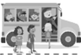
Tomar el bus